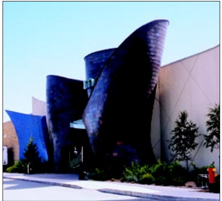
The dramatic entrance contrasts with the rest of the mall's architecture.

La Maison Simons chain of fashion department stores, established in 1889 and based in Quebec City, undertook a recent expansion into other Quebec locations. Their new store in Sherbrooke is one of six across the province. It features an expressive, copper-clad façade at the entrance, consisting of a series of organic shapes that appear to grow out of the ground. The shapes are clad in small 16-oz. copper squares, giving the appearance of scales. Because of the various curves of the structure, they reflect light and create colours that vary over the exterior of the store.