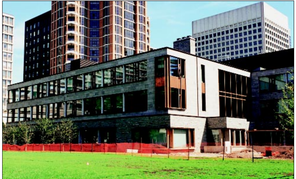
Nouveau siège social de la société McKinsey and Company.