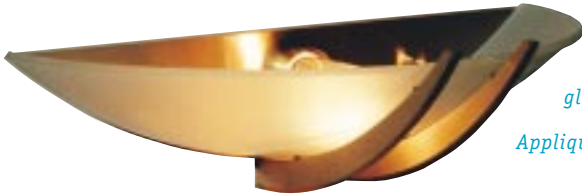
A finished wall sconce of bronze and glass.

Applique murale finie en bronze et en verre.