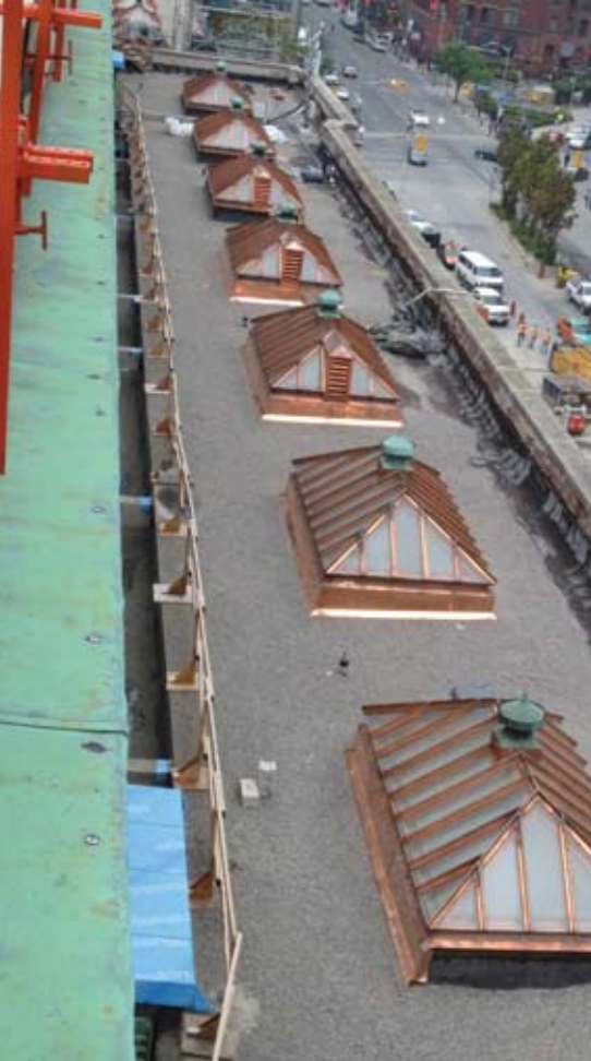
New skylights along the Front Street wing of the Station.