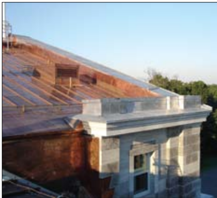
Both plain and coated copper sheet were used for the roof and cornice detailing.

Originally built as a single-family house, Rideau Hall has grown and expanded over the years along with its official role as the residence of Canada's Head of State, the Governor General. Now slightly larger than 8,500 m 2 (91,000