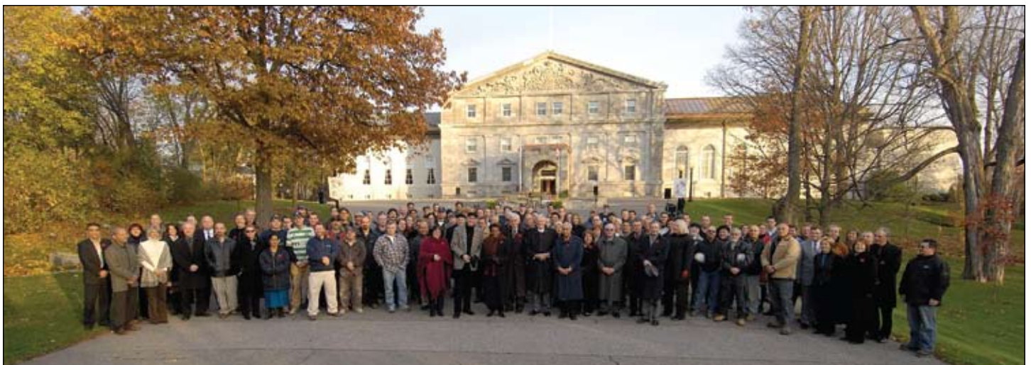
Then Governor General Michaëlle Jean, her staff and the Flynn team.

The work was carried out by Flynn Canada Ltd., a firm with much experience in Ottawa and across the country in copper roofing, both for contemporary projects such as the Canadian War Museum, also in Ottawa, featured in Canadian Copper , No. 153, and historical projects such as Rideau Hall. Many of the historical details were complex and examples of the fine work Flynn prides itself on. ♦