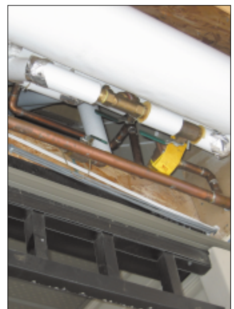
Portion de la tuyauterie dans le garage.

Section of copper piping system in a garage.