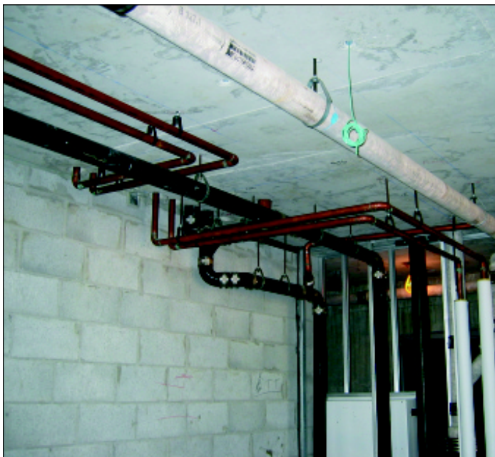
Copper hot and cold water supply lines (1½-in size shown) are neat, compact and efficient. Note some water lines are insulated.

Conduites de distribution d'eau pour la salle de bain et la douche, y compris les soupapes d'arrêt des coups de bélier.