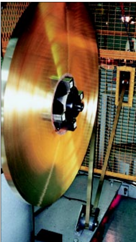
C26000 brass strip in coil form is fed from the feed spool into the roll forming portion of the production line.

A l'usine, la bande de laiton n° C26000 enroulée sur une bobine débitrice défile sur un rouleau de formage.